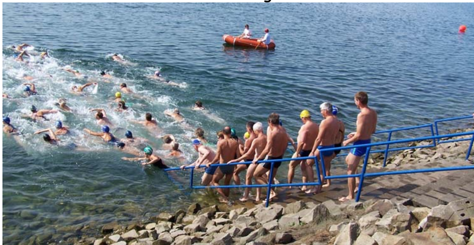
Massenstart zum 1000-m-Rennen