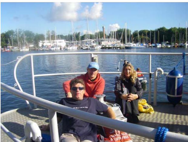
Überfahrt auf die Insel Vilm

Der Wettkampf in seiner Organisation und Durchführung einschließlich der sportlichen Herausforderung für die Teilnehmer hat uns wieder sehr imponiert und für weitere Starts - vielleicht auch als offizieller Vereinswettkampf - interessant gemacht. Wir würden uns jedenfalls freuen, wenn dieses Jahr noch ein paar mehr Schwimmer mit uns an den Start gehen.