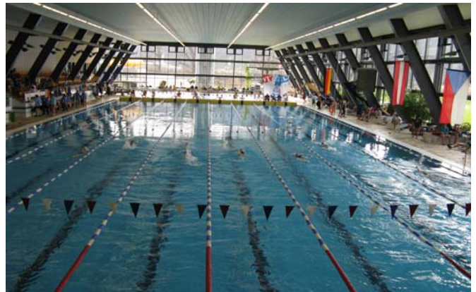
Blick in die moderne Schwimmhalle