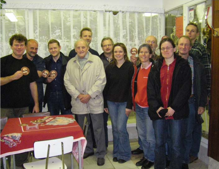
Mannschaftsfoto USV TU Dresden

Am zweiten Novemberwochenende fanden die 20. Internationalen Masters - Wettkampfe in der 50 Meter Schwimmhalle in usti nad Labem statt, an denen 13 Mitglieder des USV TU Dresden teilnahmen.