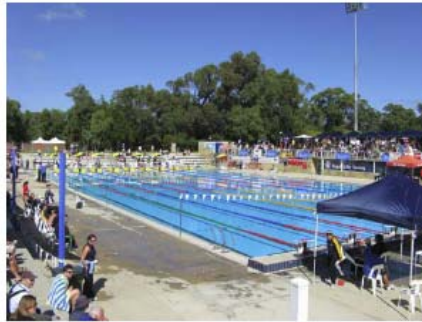
Wettkämpfe im Freiwasser