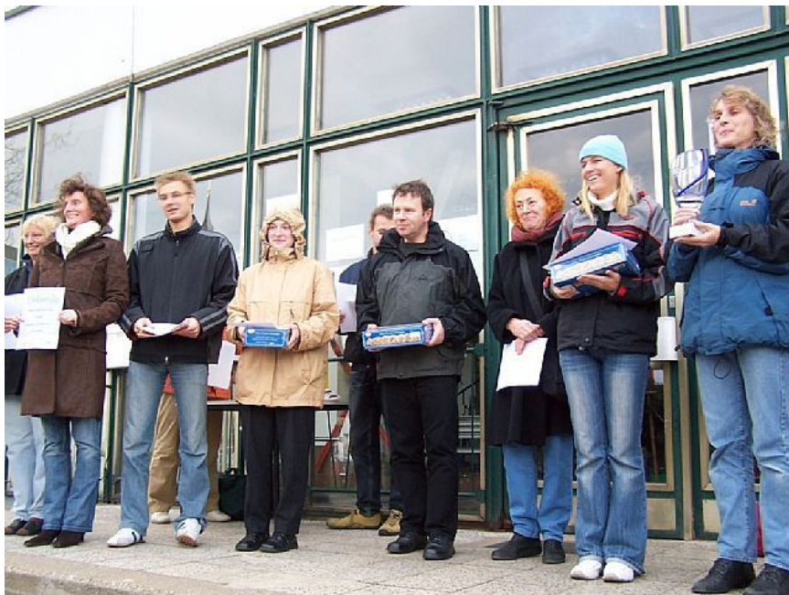
Siegerehrung in der Mannschaftswertung, wie jedes Jahr auf der Treppe vor der Schwimmhalle

Für den 10.WTC-Pokal, der traditionell am 1. Adventswochenende stattfindet wünsche ich uns, dass wir wieder so eine starke Mannschaft zusammen bekommen und den Pokal verteidigen können.