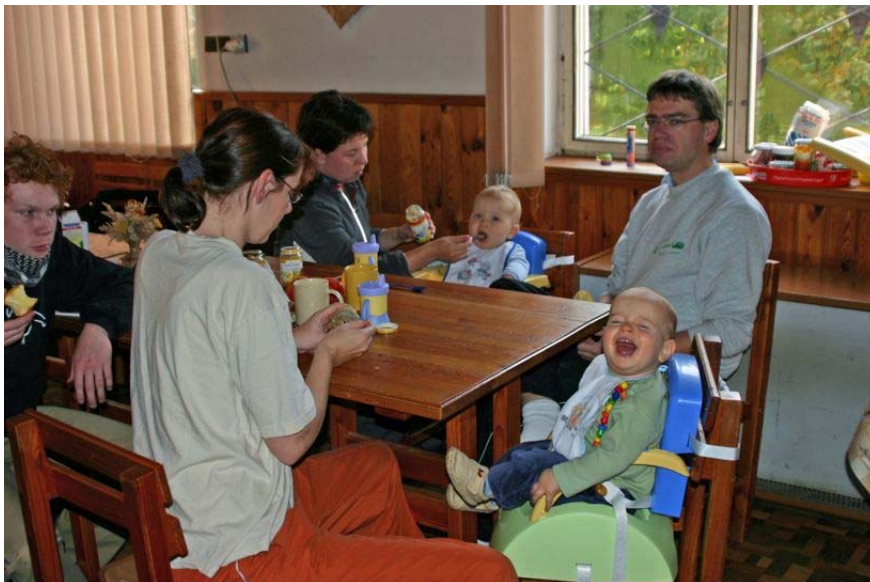
Ein Teil des Trainergespanns kümmert sich gerade um die Aller kleinsten.

Ab Sonntag setzte dann die Routine ein, täglich mind. 1 x Wassertraining, 1 x Athletik, Mo & Do 2 x Wasser, sehr gute reichliche Mahlzeiten in der Pension sowie viel Spiel und Spaß an der frischen Luft. Höhepunkt war wie jedes Jahr am „Berg der Qualen“ der Berganlauf, der allen doch einiges abverlangte. Weiterhin gab's die obligatorische Disko, den Vergleichswettkampf mit dem Verein in Litomerice, die Nachtwanderung und das Lagerfeuer mit Knüppelkuchen.