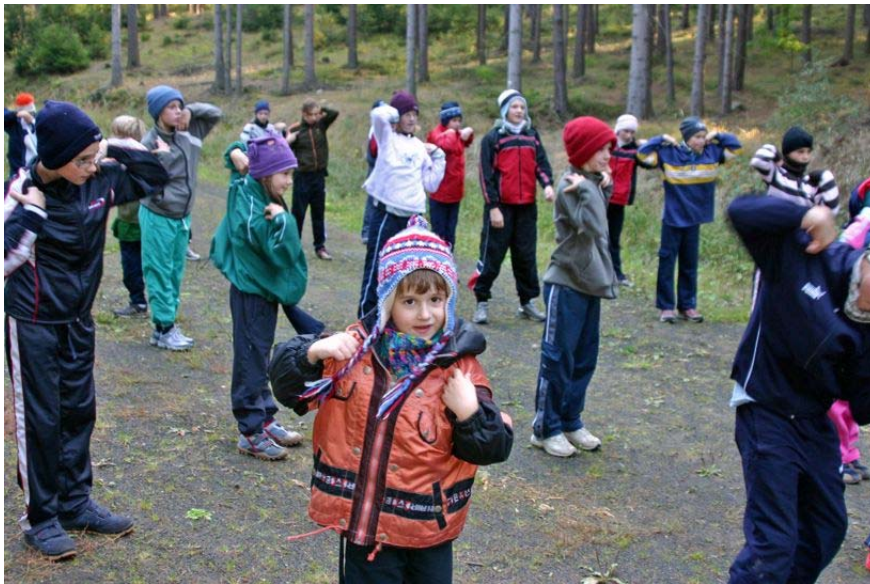
täglich begann der Tag mit Morgensport im Freien

Dann sind wir brav weiter geschwommen und der Spaß war zu Ende. Ich werde es nie vergessen.