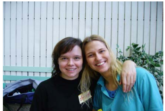
Mannschaftsfoto der Dresdner Teilnehmerinnen

Für alle 50m-Stecken gab es Finals, bei denen die schnellsten 8 pro Jahrgangswertung gegeneinander schwammen. Leider war es dem Veranstalter, 1.Potsdamer SV 1990 e.V., nicht gelungen die weiblichen Finalläufe zwischen die männlichen Strecken zu verteilen. So hatte man keine Verschnaufpause, wenn man im Finale über 50m um Geld und 10 Minuten später auf 100 oder 200m um seine Bestzeit schwamm.